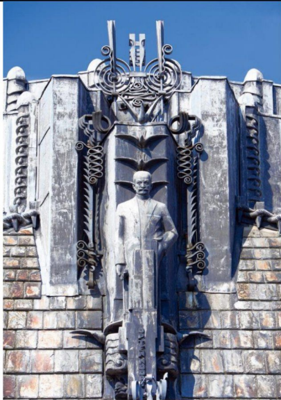
Beelden en ornamenten van Hildo Krop uit ca. 1927 op de gevel van het Grand Hotel Amrâth in Amsterdam. Midden: Hildo Krop in zijn atelier, 1964.